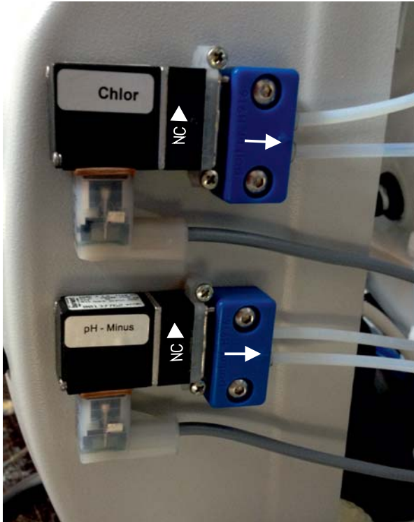
Ansicht: eingebaute Wippenventile im Pool (Pfeile von den blauen Klemmböcken zeigen vom Wippenventil weg!)